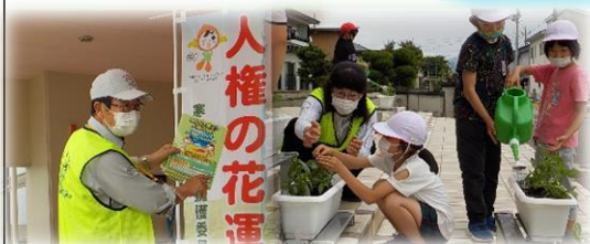
【3年生「人権教室・花植え」】

寒河江税務署の方が講師となり、6年生が税金について深く考える授業をしていただきました。