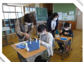
【5年生「家庭科・裁縫」】

地域学校協働活動として、地域ボランティアの方から、5年生の家庭科の授業をお手伝いいただきました。子どもたちの技術が上がっています。