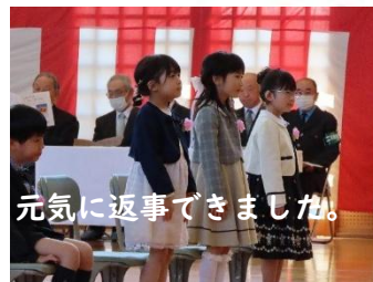
元気に返事できました。