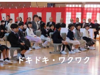
ドキドキ・ワクワク

児童代表 歓迎の言葉 六年 児童代表 新入生のみなさん、ご入学おめでとうございませう。 今日からみなさんは、この谷地南部小学校の仲間入りです。小学校には楽しいことがたくさんあります。休み時間にみんなと遊んだり、食堂でおいしい給食を食べたり、みんなが歌を歌ったりします。最初はわからないことがあってもドキドキするかもしれないけれど、困ったときは近くにいるお兄さんお姉さんにいつでも聞いてください。例えば、「あれは何か」と不思議に思ったり、「どうしたらいいんだろう」と困ったりしたら、近くにいるお兄さんお姉さんに声をかけてください。みんな優しく教えてくれます。 私たちは学ぶことも大好きです。私は特に本をたくさん読んでいきたいと思っています。一年生のみなさんも、楽しみながら新しいことをたくさん学んでください。これから一緒に、この谷地南部小学校で、たくさんの思い出を作ってくださいませう。