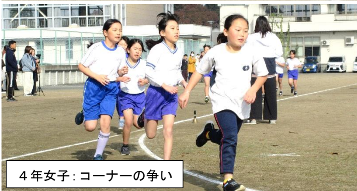
4年女子：コーナーの争い