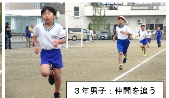
3年男子：仲間を追う