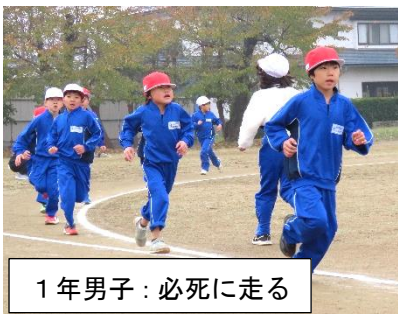
1年男子：必死に走る