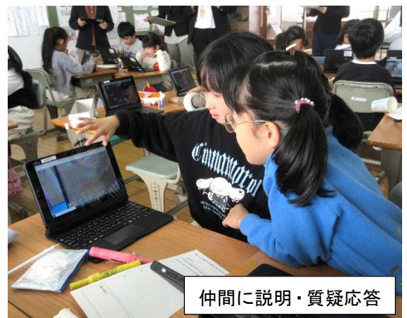
仲間に説明・質疑応答

などのご指導をいただきました。今後、説明から文章を書くことに学習がステップアップするので、接続語や重要な語句・文をしっかり押さえる指導を期待しています。