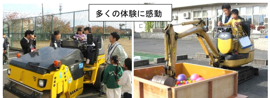
多くの体験に感動

西村山建設業組合青年部の皆様方のご好意により、1年生がたくさんの働く自動車に触れる機会を得ることができました。実際に運転席に乗せていただいたり、機械を操作してボールをすくい上げたりし、仕組みや働きを学びました。国語の学習と体験を繋げることで、学びが深まりました。