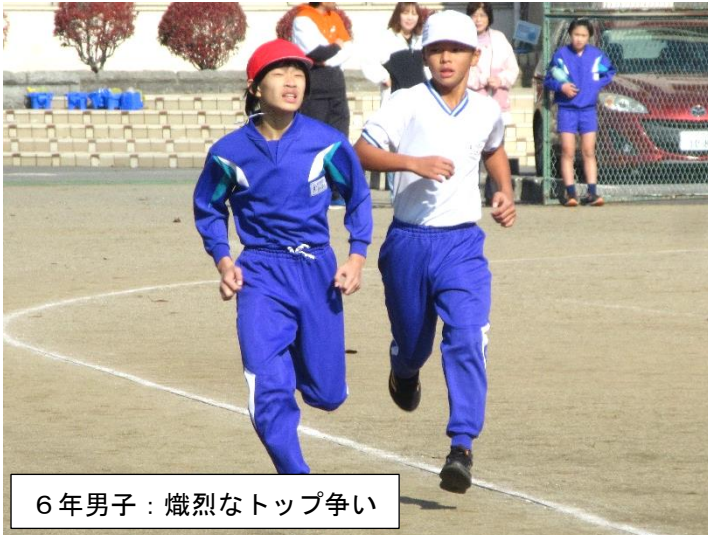
6年男子：熾烈なトップ争い

11月14日（木）に、校内持久走記録会を開催しました。体育の授業のほか、約2週間に亘って中間休みも走り込み、力を伸ばしてきました。また、1・2年生は特別講師も招聘し、体の動かし方や走るポイントを学ぶ機会に恵まれました。当日は、力強く粘り強い走りを見せてくれたほか、仲間への応援も素晴らしいと感じました。たくさんの保護者とご家族の皆様方より温かいご声援をいただき、本当にありがとうございました。