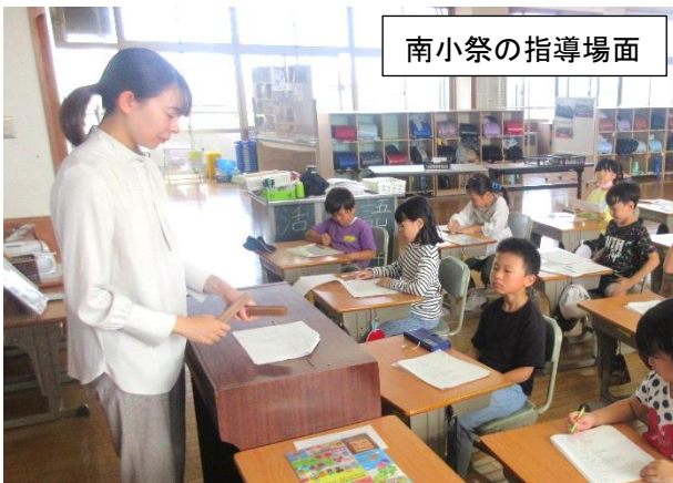
南小祭の指導場面

A 子供たちが「今日の授業、楽しかった！」と言ってくれた時や、子供たちが夢中になって学習に取り組んでいる時です。一生懸命準備して良かったなあと思います。