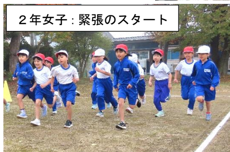
2年女子：緊張のスタート